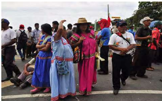
Damas. La representación de la mujer ngäbe ha tenido protagonismo en los últimos días y las personas han comenzado a respetar a las originarias de la comarca cuando se han mantenido por sus derechos.

Son el mundo femenino, la cara íntima y no por ello menos verdadera e importante del ser real de Panamá